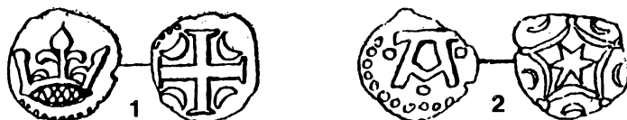
Fig. 3. Mynttyper präglade i Lund under Erik Magnusson 1357-1359.